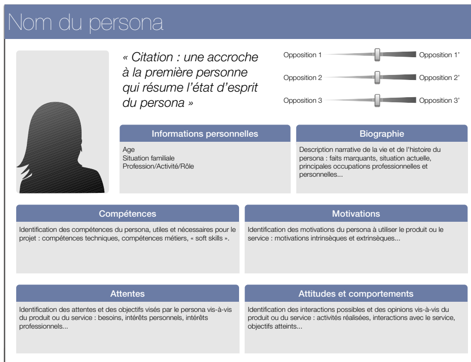
Figure 13-4 Exemple de mise en forme d'une fiche persona

Chaque persona est présenté sur une fiche synthétique, dont le format n'excède pas une page A4. De nombreuses possibilités de mise en page existent et vous êtes libre de représenter vos personas de la manière qui vous semble la plus adaptée à votre projet. Veillez simplement à ce que les fiches personas soient esthétiques et attractives pour encourager l'équipe de conception à les utiliser. Vous trouverez en ligne des modèles de personas à télécharger et même des outils de création interactive, par exemple le User Persona Creator de Xtensio ( http://xtensio.com/project/user-persona ). Vous pourrez également vous inspirer de notre modèle (figure 13-4)